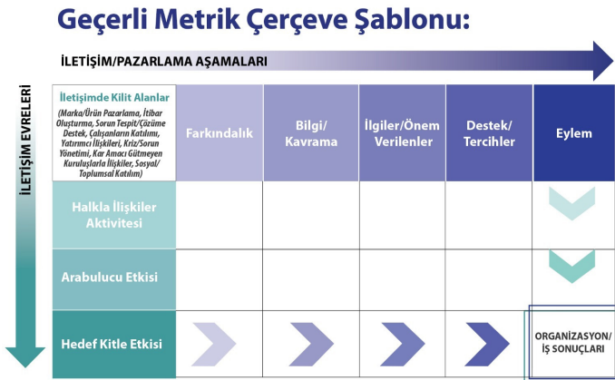
Şekil 5.1. Geçerli Metrikler Çerçevesi, AMEC

Barcelona İlkeleri'nin ardından, AMEC tarafından kurulan komisyon tarafından belirlenen Geçerli Metrikler Çerçevesi Modeli, halkla ilişkilerde ölçümlene alanında sözü edilmesi gereken önemli bir yaklaşımdır. Model, halkla ilişkiler çıktısını üç farklı aşamada dağıtır ve basit bir matris ızgarasında beş aşamaya ayırır (Bkz. Şekil 5.1.). İlk olarak, belirli bir kampanyayla alakalı ızgara seçilir; daha sonra kampanya süresince yapılacak faaliyetler belirlenir; uygun ölçümler seçilir; mevcut uygun kaynaklar gözden geçirilir ve belirlenir. Son olarak sonuçlardan hangisinin müşteri için uygun olduğuna karar verilir. Bu model, olası ölçütleri tanımlamak için yararlanılabilecek basit bir kılavuz olup, kesin bir ölçüm kuralı değildir (Jain, 2014).