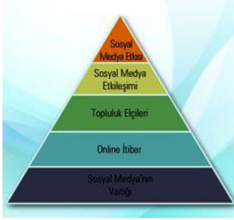
Tablo 3: Beycon Piramidi

Bu analiz çerçevesinde Koç Holding, ülke meselelerinde toplumsal hareketleri ve dinamikleri yönlendirebilecek doğru kampanya ile ortaya çıkmış ve kampanyasını uzun yıllar sürdürmeyi başarmıştır. Doğru strateji, marka itibarını da güçlendirmiştir. “Sosyal medya; ortaya atılan fikrin, hizmetin, markanın, ürünün konuşulduğu, beğenildiği yada yerildiği bir yerdir. Kurumsal sosyal sorumluluk kampanyaları çerçevesinde toplumsal hareketleri gerçekleştirebilmek adına uygun bir ortamdır.”