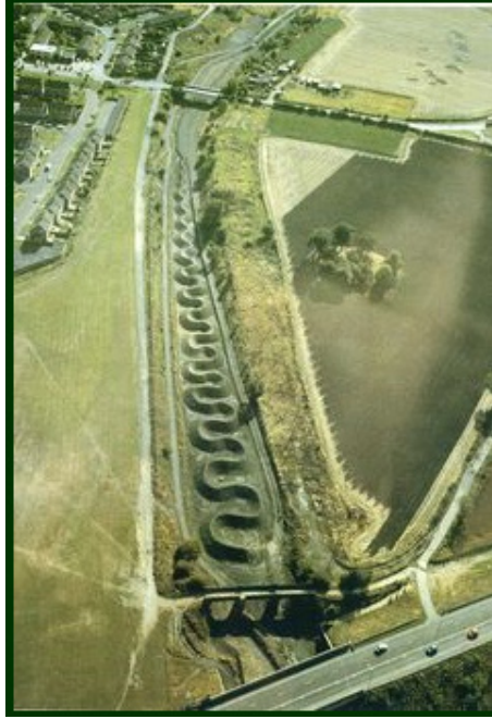
Resim 6: Andy Goldsworthy'nin "Lambton Earthwork" Çalışması (1988) ( https://www.pinterest.com/pin/514184482428014252/ )

çalışmasının zamanla göl su seviyesinin altında kalması bu duruma verilebilecek çok güzel bir örnektir.