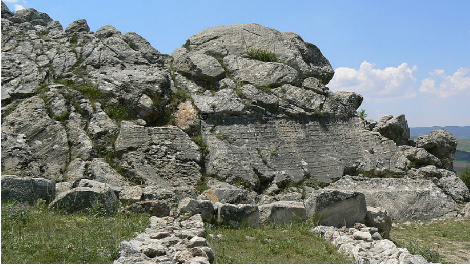
Resim-17: Nişantaş/Nişantepe Yazıtı, Hattuşaş